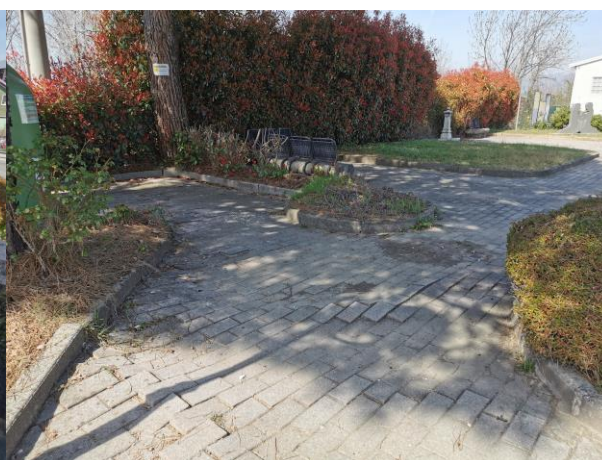
2 – Vista del parchetto