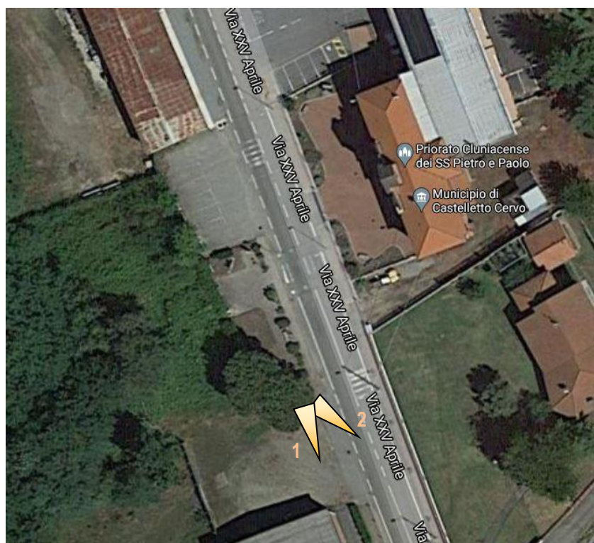
Ortofoto dell'area oggetto di intervento con indicazione punti di ripresa fotografica