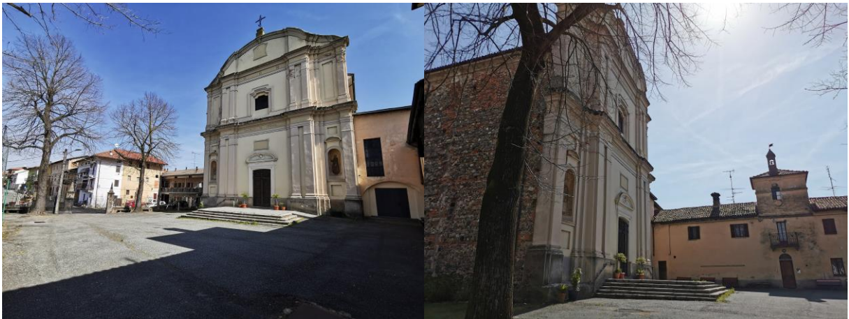
1 – Vista del Sagrato