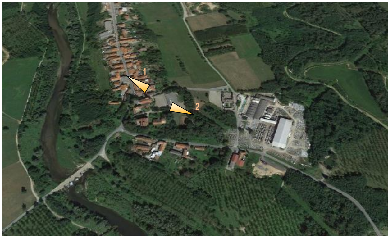
Ortofoto dell'area oggetto di intervento con indicazione punti di ripresa fotografica