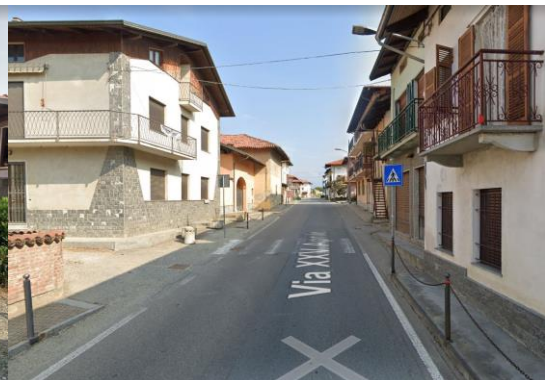
2 – Vista di via XXV Aprile