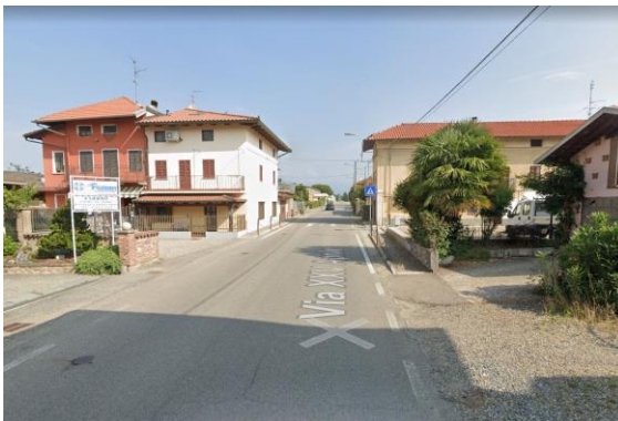
1 – Vista di via XXV Aprile