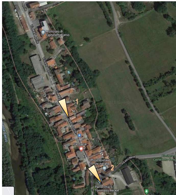
Ortofoto dell'area oggetto di intervento con indicazione punti di ripresa fotografica