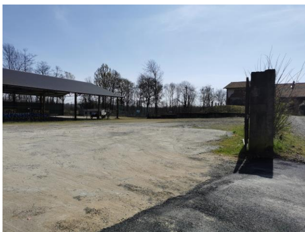
1 – Vista dell'area di intervento