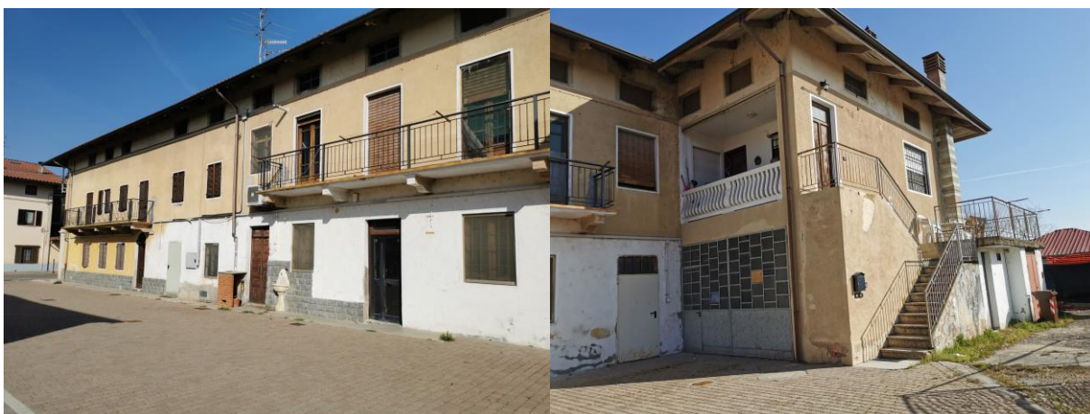
1 e 2-Prospetto sud