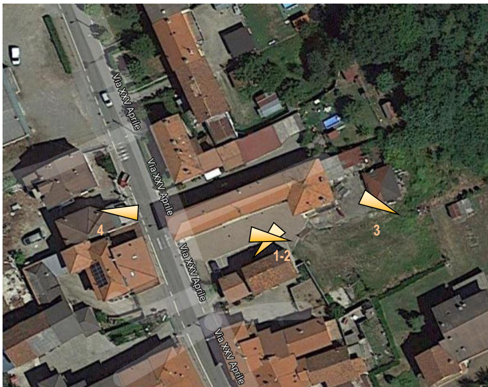
Ortofoto dell'area oggetto di intervento con indicazione punti di ripresa fotografica