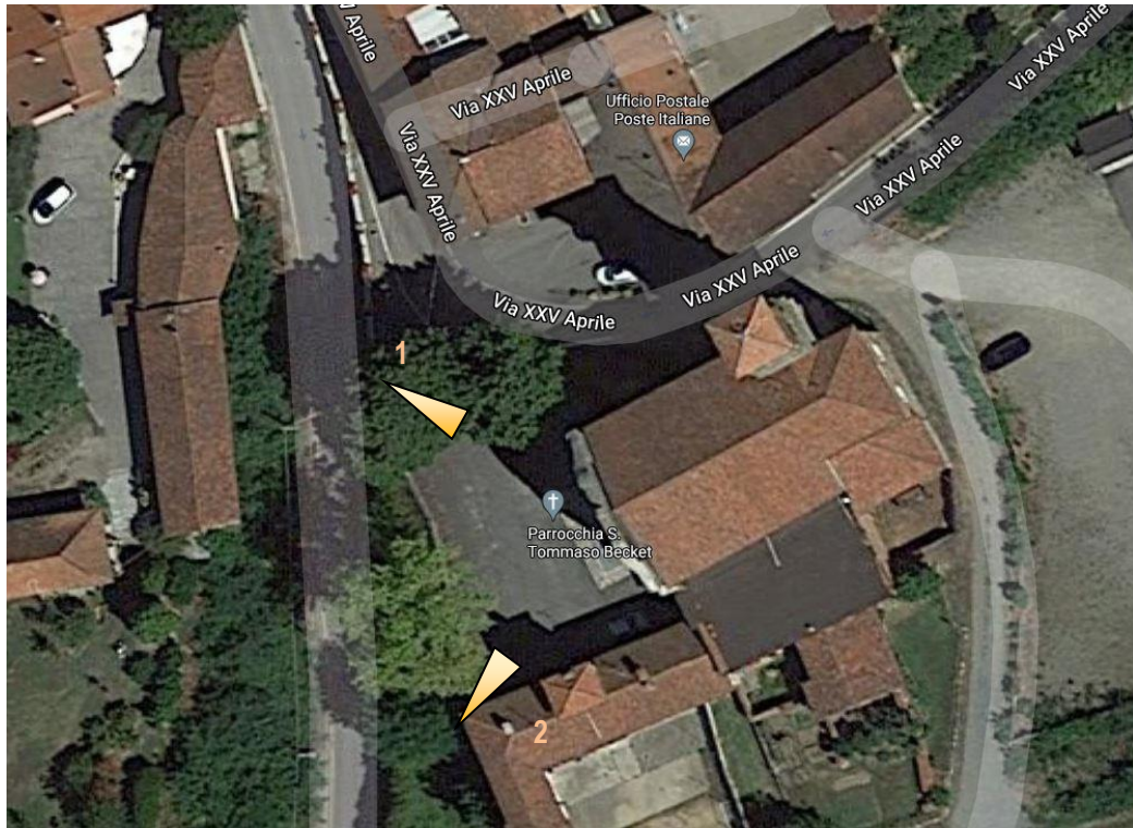
Ortofoto dell'area oggetto di intervento con indicazione punti di ripresa fotografica