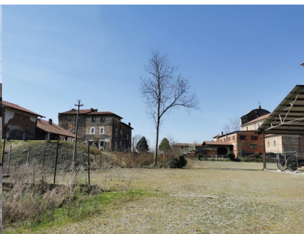
2 – Vista dell'area di intervento